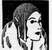
Modische Filzkappe It. Bild, seitlich Filznetz, zweifarb. Filzsch. 3.90