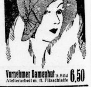
Vornehmer Damenhut It. Bild Altierhaare u. Filzschale 6.50

Im Interesse des kaufenden Publikums haben wir unsere Spezial-Abteilung für