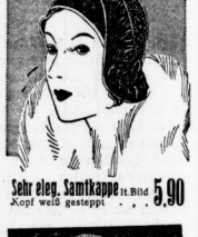
Sehr eleg. Samtkappe It. Bild Kopf weit gesteppt 5.90