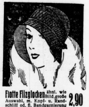
Flotte Filzjacken mit wie Auswahl, m. Kopf- u. Handschiff od. f. Bandgarnierung 2.90