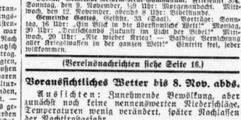
Wissenschaftliches Wetter bis 8. Nov. abds. Am Sonntag... Wetterkarte.

Am Sonntag... Wissenschaftliches Wetter bis 8. Nov. abds... Wetter.