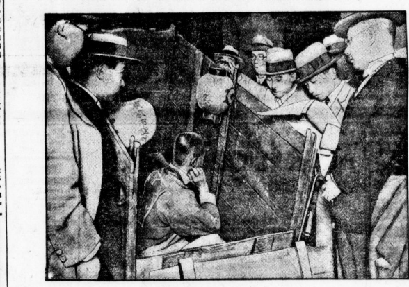
Ein Mann, der von den Kamillieren in einer Stube schliefen wurde. In Spanien wurde kürzlich eine Volkszählung durchgeführt...