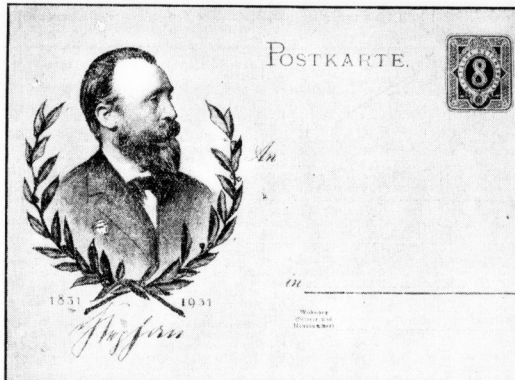
Die neue Postkarte der Reichspost, die anlässlich des 100. Geburtstages Heinrichs v. Stephan, des Schöpfers der deutschen Reichspost, herausgegeben wurde...