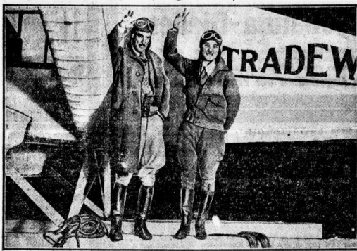
Die amerikanische Wollin W. ... Die verschollenen Dzeankflieder.