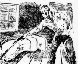
Hartmann sitzt in die ...