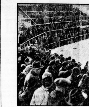
Die deutsche Eiskugelbande im großen Schäldeube bei Oberhof. Die Weltmeisterschaftsmedaille im Zweierdob in Oberhof eroberten mit einem kleinen Sieg bei deutschen Bob-Deutschland II (Klein-Güter), bei die Weltmeisterschaft eroberten einen großen Erfolg besaßen sie, das, wie gemeldet, der zweite deutsche Bob den zweiten Platz besaßen konnte.