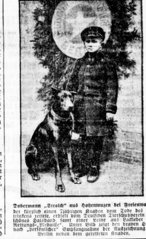
„Stroch“ als Kutschmann bei Frieledorf...