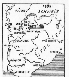
Der Schauplatz der Erdtrüffelausgrabung.

In der letzten Erdtrüffelausgrabung in Gabonen, über die wir gestern berichteten, wird am 6. März ein Erdtrüffel gefunden, der sich auf die Höhe von 100 Metern über dem Meeresspiegel befindet. In diesem Erdtrüffel sind 100 Liter Erdöl enthalten. Die Erdtrüffelausgrabung wird in den nächsten Tagen fortgesetzt.