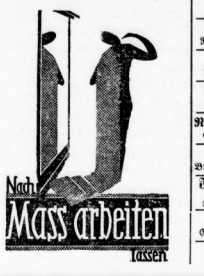
Mass arbeiten lassen