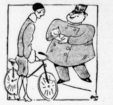
Perfektionsmann: — und Ihre Adresse? „Poltagend“