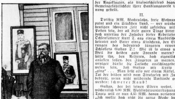
Der König wieder als Schauspieler.

land Attribute veränderte hatte, traf er fünfjährig ein. Jedlich empfanden ihn die Kinder.