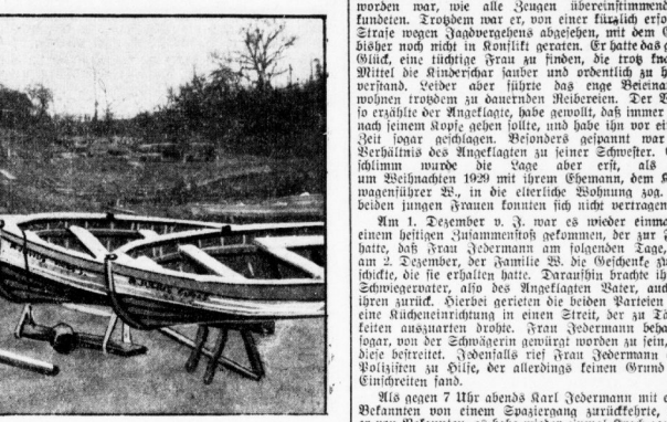
Die Note erhalten einen neuen Anstrich.