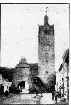
Zörbigs historisches Hallisches Tor, von dem nur der Turm erhalten ist