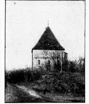
Die Kapelle auf dem „Landsberg“

Industrieerflochten Landsberg, trotz der Ebene, trotz der Meier! Witterfeld, Venna und Böhle sind die Kraftzentren, die bis hierher wirken. Und Landsberg selbst bietet mit Jander, Wals und Malchinerfabrik Arbeit und Brot. Aber nicht überall mehr