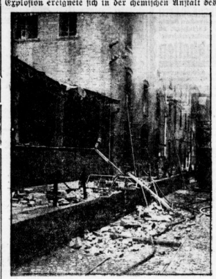
Sin der Explosionsstätte.

Die Schreckenskunde in der Mittagszeit. Die furchtbare Explosion in der Saccharin-Fabrik (Fabrik) ereignete sich zu einer Zeit, als in allen Teilen der Fabrik gearbeitet wurde.