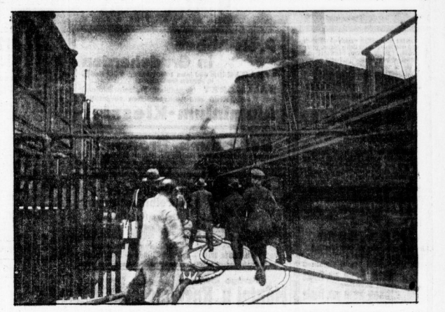
Wenige Sekunden nach der Katastrophe. Am Hintergrund das brennende Gebäude.

'Wenige Sekunden später', so erzählte der Arbeiter, 'sah ich, wie aus einem Fenster des ersten Stockes eines der Wächler stürzte. Das Wächler brannte lichterloh, und ich