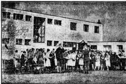
In Wluden an der Derge in der Provinz Hannover ist unter großer Teilnahme der hiesigen Jugend eine neue Jugendherberge eingeweiht worden...