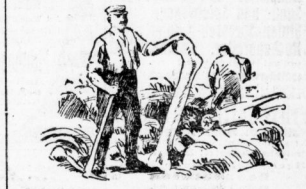
Ein Oberschenkel — 1,42 m lang.

Dieser Elephas primigenius Fraasi, der im Schotter von Zeinheim in der Nähe des Neckars entdeckt wurde, gehört zu den größten überhaupt in der Naturgeschichte bekannten Elefantentier. Das uns erhaltene Skelet ist riesenhaft. In den Schritten mißt es nicht weniger als 37 Meter in der Höhe,