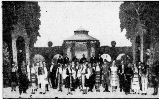
Lehár Operette im Stadttheater / Bühnenbild von Heinz Behrens.