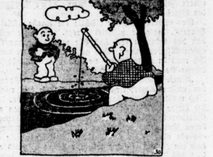
"Was angeln Sie denn da?" "Borste!" "Haben Sie welche gefangen?" "Re-e!" "Oben...