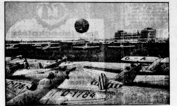
Der Flughafen von München während der Einweihungsfeier. Der neue Flughafen von München ist jetzt fast bis zum Verfall eröffnet worden.