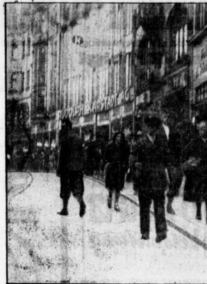
Das Leben in den Geschäftsstraßen Halles