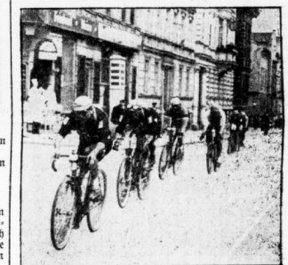
Das Gros des Feldes.

Sonnabend mittag — Riebeckplatz — Deutschlandfahrt für hallische Beiräte. Vetter neuerlich Impuls vor dem Boden — Verkehrsarbeiten — und — reelle Anteilnahme an dem Stück internationalen Sportgeschehens, das da durch Halles Mauern tolt. — Kurz, alles kurz der eigentliche Moment der Durchfahrt. So kurz und so schnell, daß Startnummern, speziell von der Halle schon mitgenom-