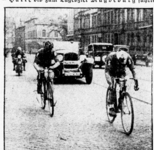
Die Spitzenfahrer in Halle.

Auf der 14. Etappe, die von Berlin über Bitterfeld — Leipzig — Halle bis zum Tagesziel Magdeburg führte,