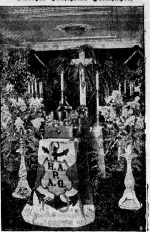
Die Ausfahrt der Urnen mit den sterblichen Überresten des ehemaligen Reichspräsidenten...