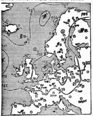
Wetterkarte für Sachsen-Anhalt am 18. Mai 1931. Wichtige Wettererscheinungen...

Die warme Mittelmeerluft, die sich allmählich über ganz Deutschland ausbreitet, dürfte nicht von Westen her langsam durch fähiger Luft ersetzt.