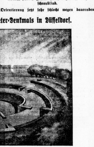
Die Anlage des von Schlageter-Gerechten in Düsseldorf... Zur Einweihung des Schlageter-Denkmal in Düsseldorf.