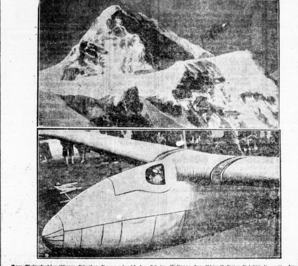
Der Weltrekordflieger Günter Greenhoff, der sich im Aufzuge der Höhenflieger-Gesellschaft mit seinem biplanarischen Flugzeug über die Jungfrau erheben will, hat sich im letzten Moment entschieden, seinen Flug zu unterbrechen und sich nach Interlaken zu begeben.

Greenhoffs Flug vom Jungfraujoch nach Interlaken.