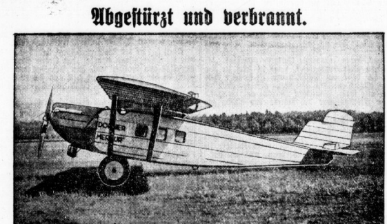
Wie wir am Sonnabend berichteten, führte fast nach dem „Werk“ bei Coorstriden ab und verbrannt.