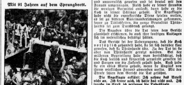
Der alte Schilmerer... Mit 91 Jahren auf dem Sprungbrett.