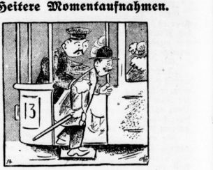
Seitene Momentaufnahmen. Schaffner: „Warten Sie, bitte, mit dem Abfertigen, bis mir helfen. Wenn Sie sich das Geduld brechen, daß ich nachher die Augen unannehmlich fühlen.“

Und in dem Herzen des alten Mädchens war bei aller Wehmüt ein freudiger Stolz, daß der Mann, den sie liebte, sich durchringen konnte zum Frieden mit sich selbst, und ein heimliches Glück dazu, daß sie seinen Lebensabend umgeben durfte mit ihrer stillen Treue. — Ende —