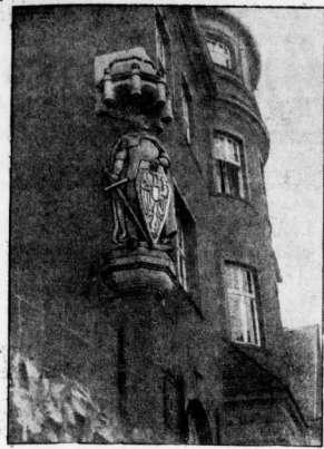
Der Bismarck-Noland am Rathaus.