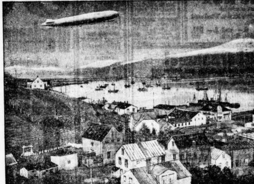
„Graf Zeppelin“ über einer isländischen Landschaft.

Das Luftschiff „Graf Zeppelin“ traf in Reykjavik auf Island ein. Die Besatzung wurde durch die Isländer sehr freundlich aufgenommen. Die Fahrt war sehr erfolgreich und hat die Popularität des Luftschiffes weiter gesteigert.