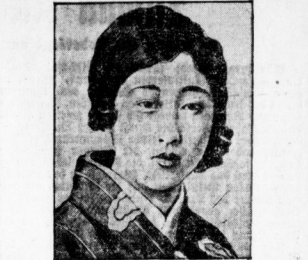
Die neugewählte Schönheitskönigin Japans, das als eine der schönsten Mädchen der Welt bezeichnet wird...