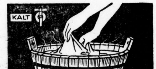
Nach Abtühlen der Waschlauge wird gespült; zuerst in gut warmem, dann in kaltem Wasser.

Wer so wäscht, hat immer prachtvoll weiße, frisch duftende Wäsche von höchster Gepflegtheit!