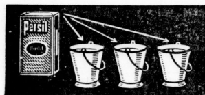
Persil wird in kaltem Wasser aufgelöst. Auf je 3 Eimer Wasser kommt 1 Paket Persil.

Schrecken genommen zu haben. Persil brachte Fröhlichkeit auch ins Waschen und Freude am Schaffen. Nur eine Bitte für Persil: nehmen Sie dieses wundervolle Waschmittel so, wie es die Vorschrift will, nur dann kommen Sie in den Genuß all der vielen großen Vorzüge, die es bietet!