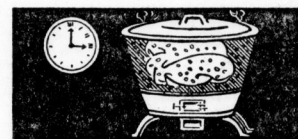
Die Wäsche wird einmal kurze Zeit gefocht; öfteres Umrühren ist angebracht.