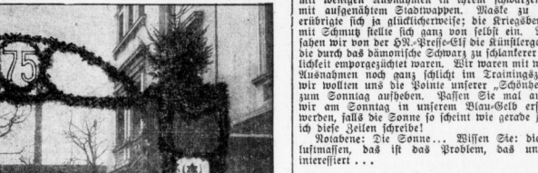
Die Jubiläums-Porte des Gastwerts am Unterplan.