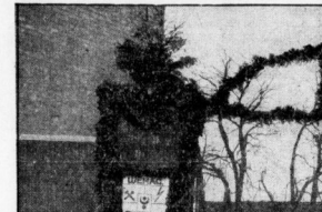
Das Jubiläums-Porte des Gastwerts am Unterplan.