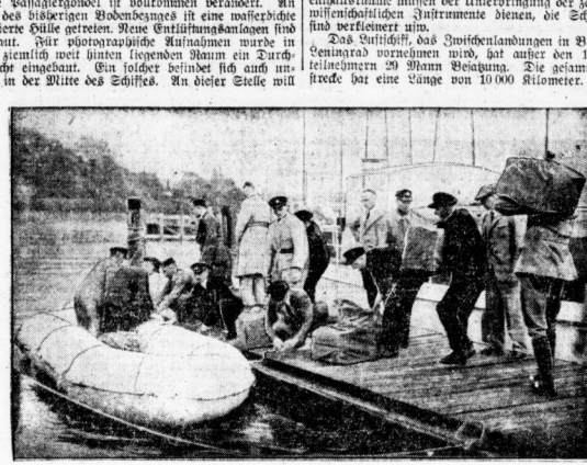
Ein neues Luftschiff wird ausprobiert. In Friedrichshafen wurden zur Zeit die letzten Vorbereitungsarbeiten zur Herbeiführung des „ Graf Zeppelin " getroffen...