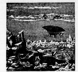
„Ein lenkbare Luftschiff bei der Erforschung der Polargegend.“ Eine Zeichnung aus dem Jahre 1883.