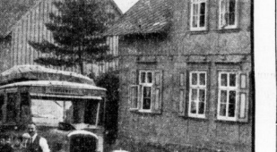
Einblick in Güntersberge.

das alte Rathaus mit seiner alten Jahreszahl geblieben. 'Sitz die 'Zehnerzahl am Marktplatz.' 'Sitz haben die Studierherren der Schule abgelehnt.