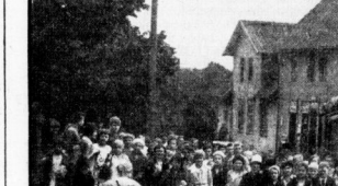
Einblick in Güntersberge.

Im Döhrze, im lieblichen Seebal, liegt ein Schloß, nicht verräumt o nein, das liegt es so sehr an der großen Zehnmarkstraße.