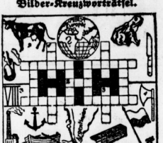
Die in die inargerechten und lehrreichen... ... ...