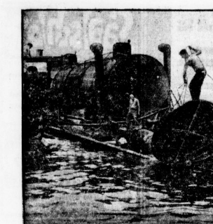
Blick auf das Deck des Dampfers nach dem Brand.