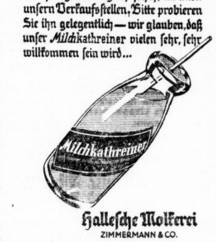
Halle'sche Molkerei ZIMMERMANN & CO.