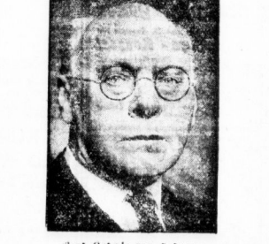
Ludwig von Hofmann, der berühmte Dresdener Maler, feiert am 17. August seinen 70. Geburtstag...