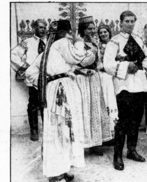
Szene aus dem „Hofentanz“ (Hochzeitstranz).

Volkstanzaufführung, veranstaltet vom Verein für das Volkstum im Ausland. Man muß mit dem Verein für das Volkstum im Ausland, Landesverband Provinz Sachsen und Anhalt, dank wissen, daß er die Truppe nach Halle geschickt hat, die aus Mitglieder des „Vereins für das Volkstum im Ausland“ besteht und am Sonntag an der Bühne der „Saalhofbühnen“ des Stadttheaters „Giebbürgen, Land des Gegens“ auftrat.