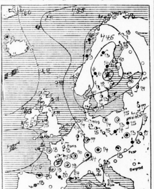
Witterungs- und Windverhältnisse am 23. August 1931. Mittelschule Halle, Saxony-Anhalt.