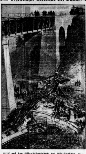
Wird auf den Eisenbahnunfall bei Budapest, nachdem die Wagen insurge der Weisungspersonen hinuntergefallen.