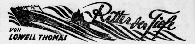
Uebersetzt und bearbeitet von E. Freiherr v. Spiegel, Kapitänleutnant a. D. Copyright 1931 by Deutsche Verlagsgesellschaft m. b. H., Berlin SW 68.

Es läßt sich denken, daß ich hoch war, mit einem neuen, schneidigen Boot, wie es 1864 war, losgelassen zu werden. Zunächst wurde allerdings meine Begleitung etwas gedämpft. Es ist klar, daß man sich die Leute, die den unerhörten Strapazen des Unterwasserbootes im Krieg genossen, nicht leisten, als abgeleitete, robuste Leute vorstellte. Die anscheinend, als könnten sie den Zweifel ans der Seele heilen. Und als ich mir meine Befragung anließ, befand ich am größten Teil aus vollständigen Jünglingen.