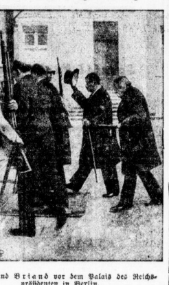
Basel und Strind vor dem Palais des Reichspräsidenten in Berlin.