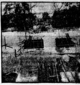
Eine von den Hünen geführte Brücke in Reibe.