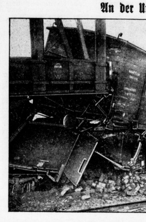
Die entgleisten und gestürzten Waggons.

* Helfender Schwindler. Die Firma Burgardt & Becker macht im heutigen „Allgemeinen“ bekannt, daß in der Umgebung von Halle Kaufleute mit Möbelpolitur handeln, unter der Angabe, daß sie von der genannten Firma angeheilt seien. Die Firma legt Wert auf die Bezeichnung, daß sie keine Vertreter für diesen Artikel seien.