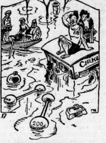
Bei der Überbrückung. „Dannemester — was werden die Leute nun von meinen Kraftleistungen denken!“