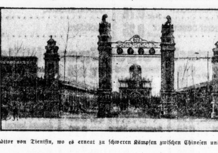
Das Schloß von Peking, wo es erneut zu schweren Kämpfen zwischen Chinesen und Japanern kam.

Der Krieg im Fernen Osten unvermeidlich? Die Sachverständigen wollen nach Hause.