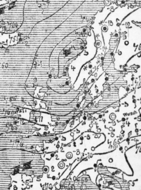
ERKLÄRUNG: o = Wolken, h = Regen, n = Nebel, b = Schnee...

Kaufstücken: Übergang zu Taumetter mit Niederschlag.