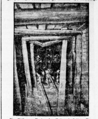
Ein Bild vom Beginn der Rettungsarbeiten: Ein Bergarbeiter wird von den Hilfsmännern zum Aufsteigen gebracht.

Um nicht unversichert zu lassen, hat man eine 150-Tonnen-Verankerung, wie sie im Krieg an der Westfront verwendet wurde, mit den Stollen genommen, in der Hoffnung, auf diese Weise vielleicht einige Seilen besser berechnen zu können. Es allerdings