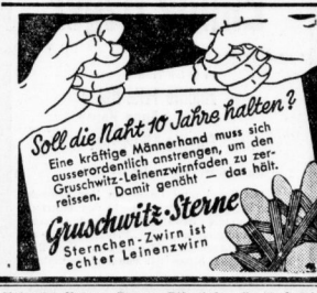
Soll die Nacht 10 Jahre halten? Eine kraftige Mitternacht muss sich Gunst erweisen...