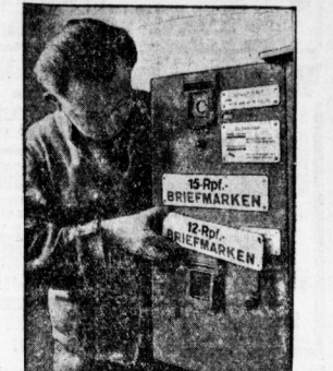
15-Pfennig- und 10-Pfennig-Briefmarken werden jetzt gedruckt...