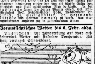
Wetterkarte mit Windrichtungen und -stärken für verschiedene Städte.