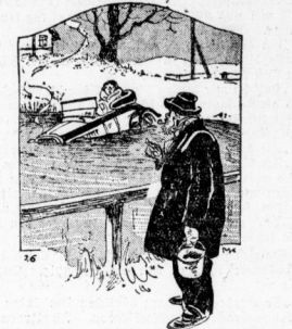
„Hören Sie mal, Sie sollten nicht so lange draß sein. Wir haben Frostmeter in Aussicht!“