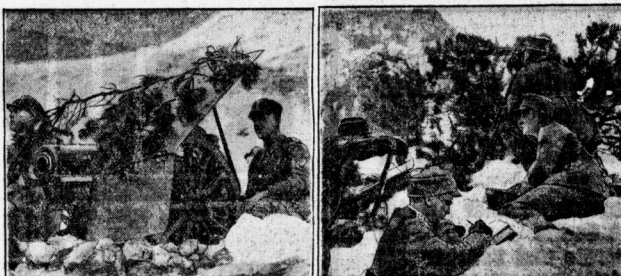
Wiederholung der Winterübungen der Gebirgsartillerie bei Garmisch-Partenkirchen.