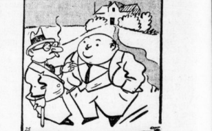
Darum nennen Sie Ihre Villa nicht mehr die... 'Kühnhalle'?