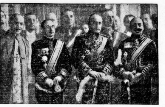
Mussolini, umgeben von Würdenträgern Italiens und des Vatikans, in der Loggia Raphael im Vatikan.