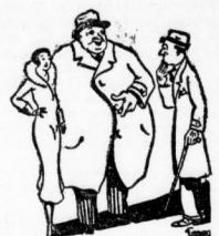
„N Tag, Schluß. Gehalte, daß ich dir meins... bessere Hälfte vortelle!...“

Das können wir von diesem Schuh mit bestem Gewissen... sagen. Solche Qualität in dieser vollendeten Arbeit haben... Sie im Frieden für diesen Preis nicht kaufen können.