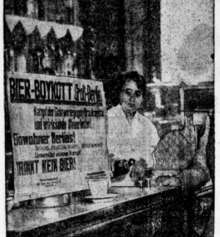
Das Plakat am Schaenflaecher zeigt zum Bierdogbot auf