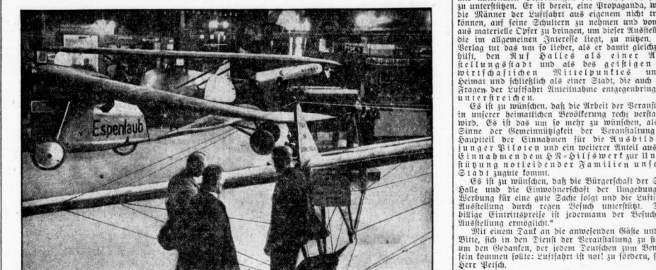
Blick in den Ausstellungsraum. Oben: Luftverkehr.