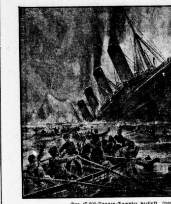
Der 47000-Tonnen-Dampfer versinkt (nach einem Gemälde von Zimmer).

Genau 20 Jahre ist es am 14. April, bei der ersten Fahrt der „Titanic“ von Southampton nach New York. Die Titanic wurde am 15. April 1912 in New York angetrieben. Die Titanic wurde am 15. April 1912 in New York angetrieben.