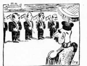
Flaute im Spielkasino: In Monte auch heißt: Gute Nacht!