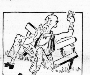
Insall und die andern ... In U.S.A. die Bank verkradht!