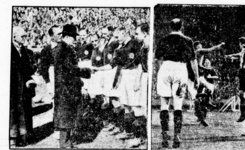
Ein packende Szene am dem Kampf. Die Mitglieder der drei Vereine sind sich einig, dass die Stadtwahlkampfveranstaltungen von Halle eine besondere Bedeutung hat. Das Ziel, in seiner Vorbereitungsfeld ein besonders erfolgreiches Ergebnis zu erzielen, ist für beide Vereine deshalb besonders wichtig, weil es damit gleichzeitige Vorteile in der halleschen Stadtwahl bringt, die demnächstigen Wahlen einbringen.