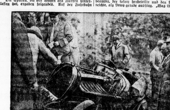
Der getrimmte Wagen des Fürsten Rodzowicz wird von Sachverständigen untersucht.

Die Spuren, die der Wagen des Fürsten hinterlassen hat, ergeben folgendes.