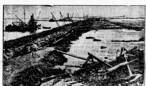
Blick auf den jetzt fertiggestellten Hauptdamm.