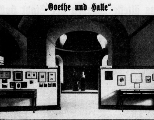
Bild in die Ausstellung in der ehemaligen Garnisonkirche. (Vergleiche das Revillon dieser Nummer.)